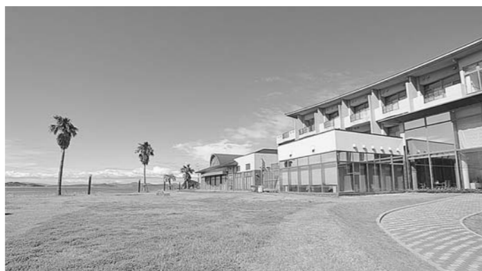
民間に売却予定の「アレガ軍艦島の施設」

質問 野母崎振興公社には、長崎市は平成27年2月議会において、公社の純資産額が2期連続して300万円未満となる恐