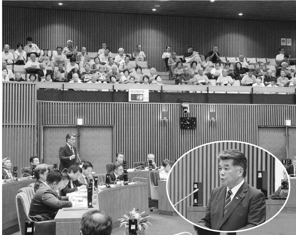
9月5日 多くの皆さんが傍聴する中、一般質問を行いました

令和元年11月 発行責任者：五輪 清隆 編集責任者：福田 剛 長崎市水の浦1の1 TEL861-6032