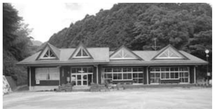
旧高城台小学校現川分校は地元自治会へ貸し出し

質問 長崎市は少子化に伴い、小中学校の学校規模の適正化と適正配置として、小中学校の統廃合を行っているが、利活用の基本方針について。