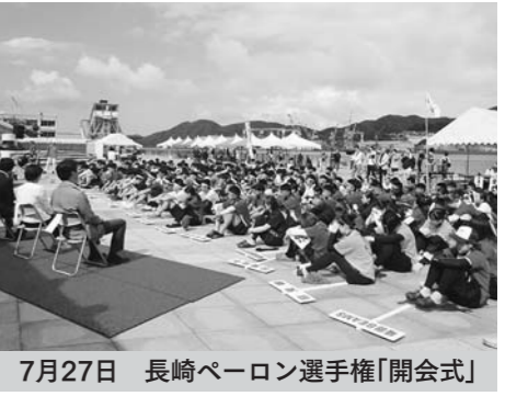
7月27日 長崎ペーロン選手権「開会式」