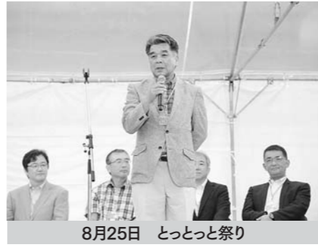
8月25日 とつとつ祭り