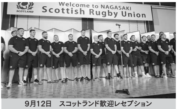
9月12日 スコットランド歓迎レセプション