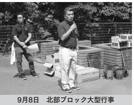
9月8日 北部ブロック大型行事