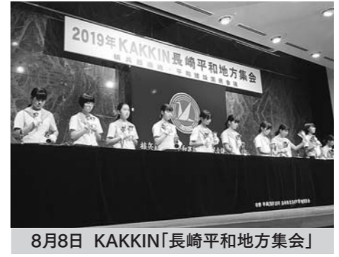
8月8日 KAKKIN「長崎平和地方集会」