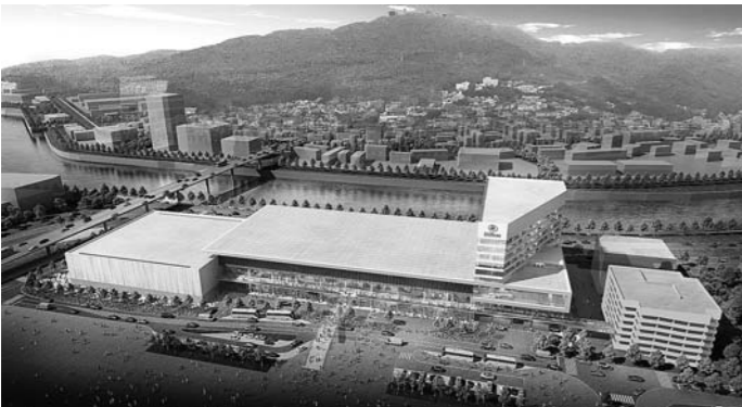
(仮称)長崎市交流拠点施設の完成予想図