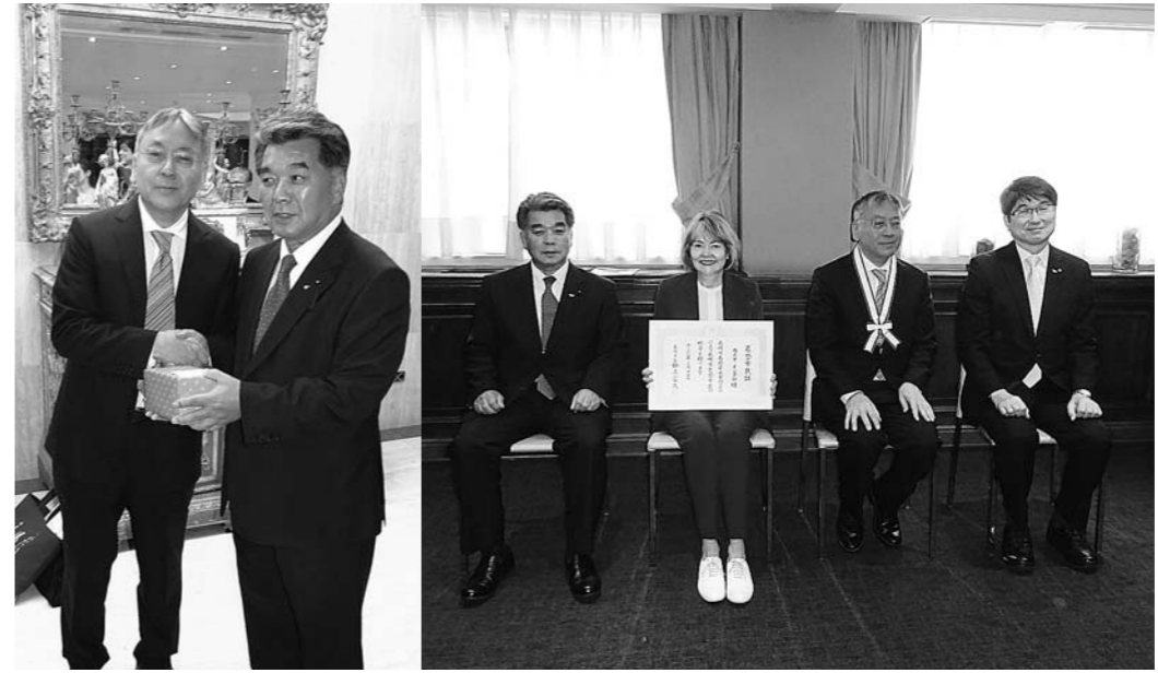
イシグロ氏へ記念品を贈呈