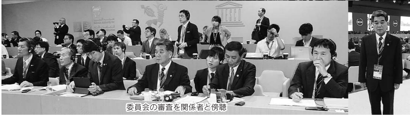
委員会の審査を関係者と傍聴

今年も暑い日々が続きますが、水分補給などを行い熱中症に十分に注意して楽しい夏を過ごして頂きたいと思っております。私も市議会議員として、市民の皆さんが「安全で安心して生活できる環境づくり」に向けて諸活動を積極的に行っていきます。皆様方には更なるご指導・ご支援をよろしくお願い致します。