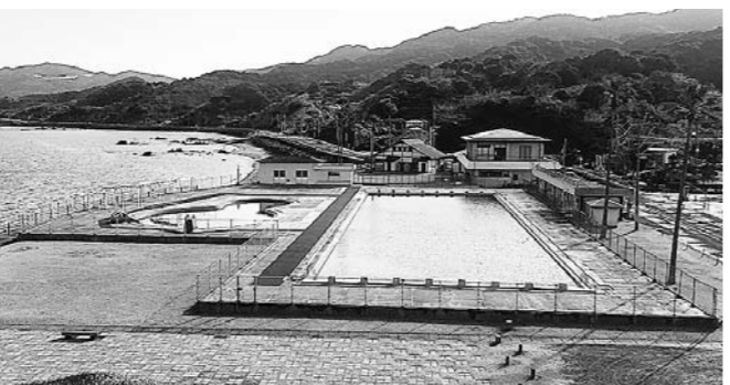
野母崎総合運動公園水泳プール