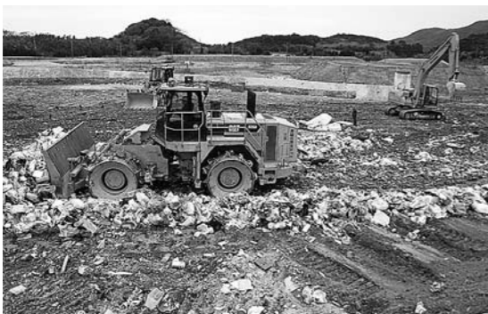
三京クリーンランド