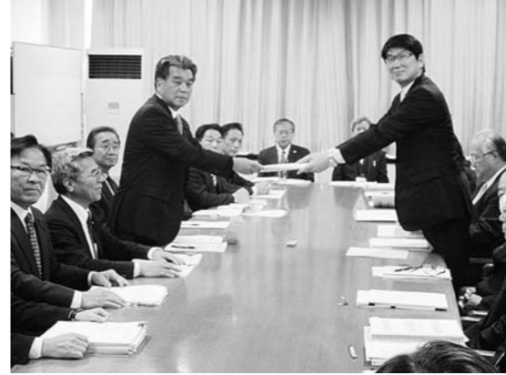
回答書を受け取る五輪団長