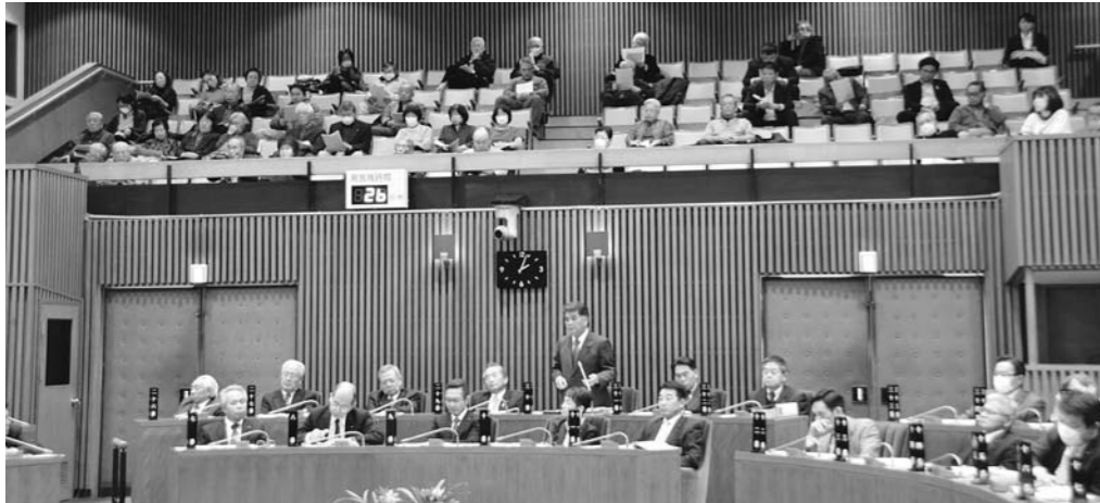
自席より多くの傍聴者の中、再質問を行いました(2月24日)

平成28年4月 発行責任者：五輪 清隆 編集責任者：板山 孝宏 長崎市水の浦1の1 TEL861-6032