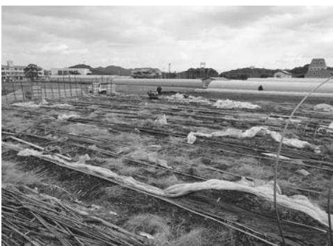
大雪による被害を受けたビニールハウス(琴海町)

㉒今年1月24日から25日にかけて、過去経験したことがない17cmの大雪とマインス4度を超える異常低温により、びわの寒害をはじめ長崎市内各地で農作物の被害が発生しております。私も2月17日に同僚議員と現地に出向き被害状況を生産者に話を聞きました。農業は自然との戦いであるので是非共、農業者がやる気が出るよう行政として最大の支援をお願いしたい。