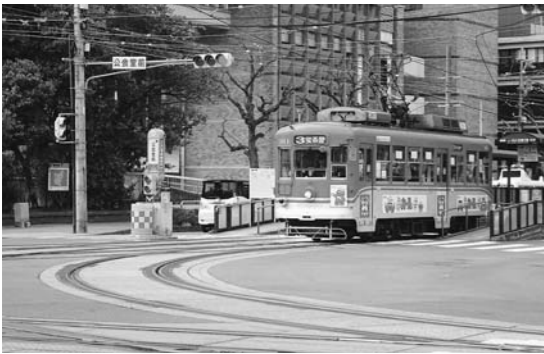
2月29日より赤迫発・蛸茶屋行線は運行しています

㉓昨年、10月11日の午後9時30分ごろ、蛸茶屋発・赤迫行きの長崎電気軌道の路面電車が公会堂前のカーブ付近で脱線事故が発生し、現在も長崎駅から公会堂前間が運休