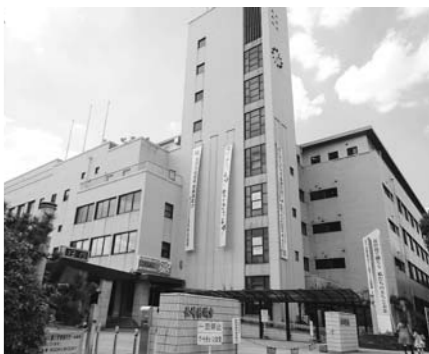
跡地活用が検討されている県庁舎

⑤平成25年11月にコンベンション施設である長崎MICセンター(仮称)整備の検討報告で市全体の財政状況と、今後10年間で想定される