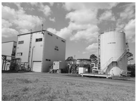
東部下処理場の「下水汚泥処理プラント」

⑫平成23年3月に国土交通省の下水道革新的技術事業へ応募して採用され、現在、東部下処理場で「下水汚泥処理プラント」の実証試験が行われているが成果と他都市から引き合いはないのか伺います。