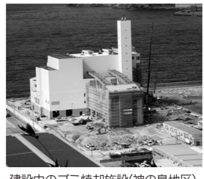
建設中のゴミ焼却施設(神の島地区)