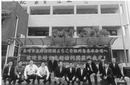
上水道の運営会社事務所前にて

昨年、11月9日（月）～13日（金）に実施された、中国（福州市）との友好都市提携35周年記念訪問団の一員として参加してきました。