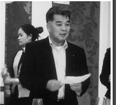
水道分野の訪問団を代表して謝辞を述べる

長崎と中国は400年以上も前から交流があり、長崎に住む華僑の方の多くが福州市出身であることから、両市は1980年（昭和55年）に友好都市提携を行い、今日まで公式訪問団の相互派遣や水道・水産分野における技術交流など、様々な分野で交流を行っています。