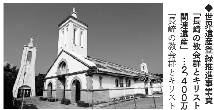
出津教会(外海地区)

◆世界遺産登録推進事業費 「長崎の教会群とキリスト教関連遺産」…2,400万円 「長崎の教会群とキリスト教」