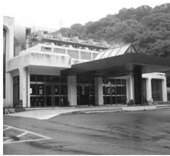
建て替えが計画されている「もみじ谷葬斎場」

長崎発の下水汚泥処理プラント (質問)平成24年3月に、長崎市と地元企業・地元大学の産学官から提案された下水道改革的技術実証事業への提案が国土交通省より採用され、今年4月よりプラントを東部下水処理場に建設して実証実験を行っているが、現在の検証実験の成果と他都市からの問い合わせはないのか、また、長崎市はどのように他都市へ発信しているのか。