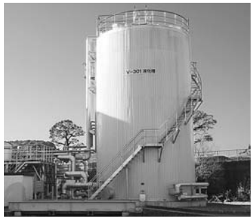
東部処理場で実証実験されている下水汚泥処理プラント

生活保護行政について (質問)全国で生活保護の不正受給が増加しているが、長崎市の状況と防止策