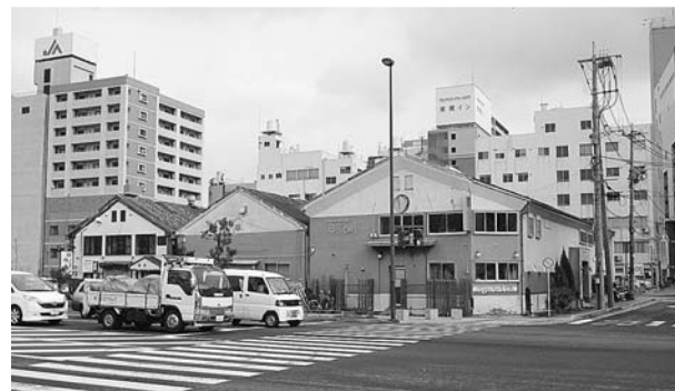
元船町の市有地(日通倉庫跡地)

(答弁) 当該地は長崎駅から大波止に繋がる市中心部の一等地に位置しており、有効活用を図ることは重要であり、早急に現存する倉庫を取り壊し最も有効な活用策を検討します。