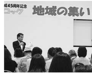
7月 北東ブロック 地域の集い