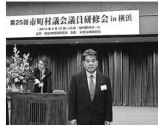
2月 市町村議会議員研修会