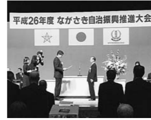
11月 ながさき自治振興推進大会