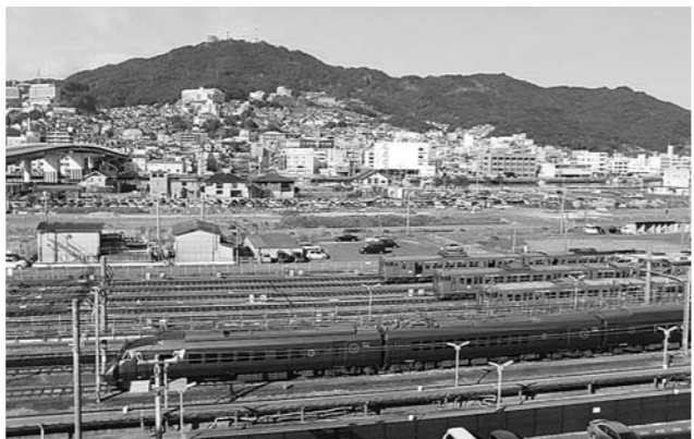
長崎駅西側にあるJR貨物(株)の所有地