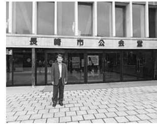
6月 長崎市公会堂の 現地調査