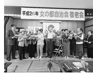
9月 女の都自治会「敬老会」