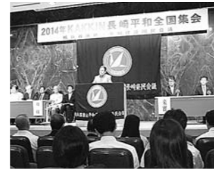
8月 KAKKIN 長崎平和全国集会