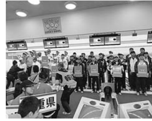
10月 がんばらんば国体 ボウリング競技表彰式