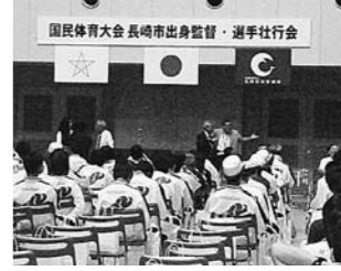
8月 国民体育大会 長崎市出身監督・選手壮行会