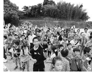
8月 女の都自治会 「夏祭り」