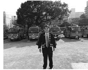
1月 長崎市消防出初式