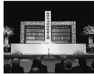
2月 消防殉職者追悼式