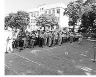
9月 連合自治会 グラウンドゴルフ開会式