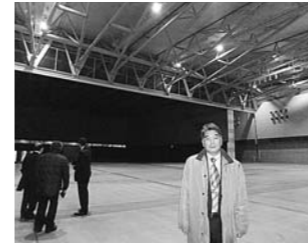
1月 新潟県のMICE施設を調査