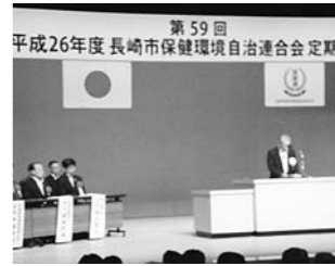
7月 長崎市保健環境自治連合会定期総会