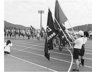
11月 小学校体育大会