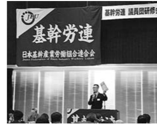
1月 基幹労連 議員団研修会