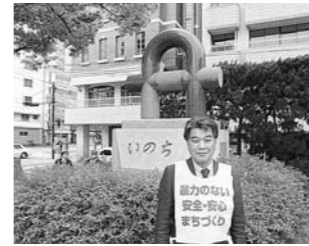
4月 いのちを守る 市民集会