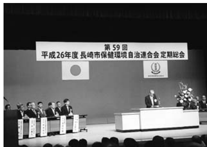
7月 市保健環境連合会総会