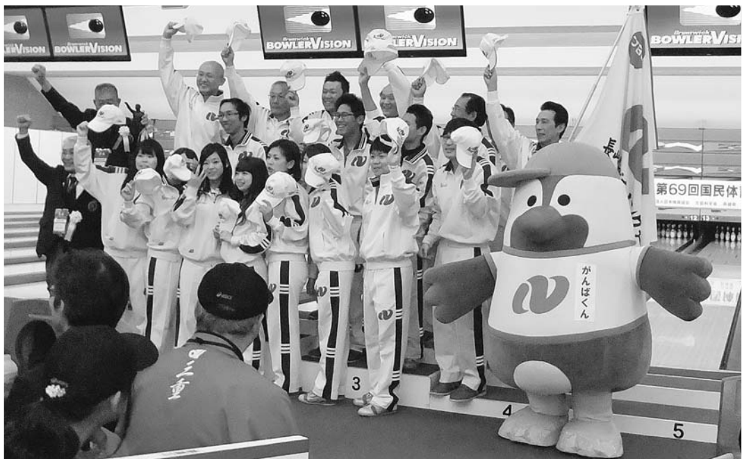
総合優勝の「ボウリング競技」選手団

平成26年11月 発行責任者：五輪 清隆 編集責任者：板山 孝宏 長崎市水の浦1の1 TEL861-6032