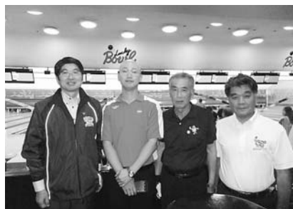
9月 長崎市ボウリング連盟で団体出場選手の決起大会を行いました