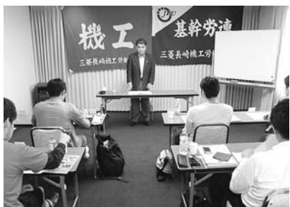
10月 労働組合「研修会」にて市政報告