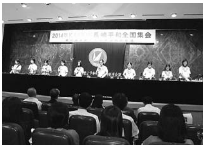
8月 KAKKIN長崎平和全国集会