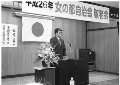
9月 地元自治会「敬老会」