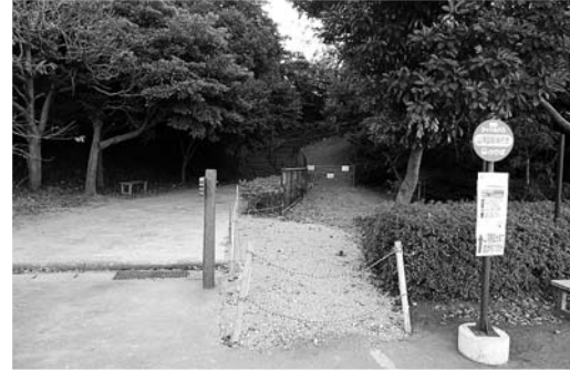
稲佐山中腹駐車場付近に植樹