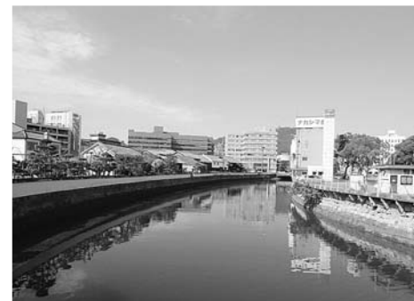
出島表門橋が架橋される中島川