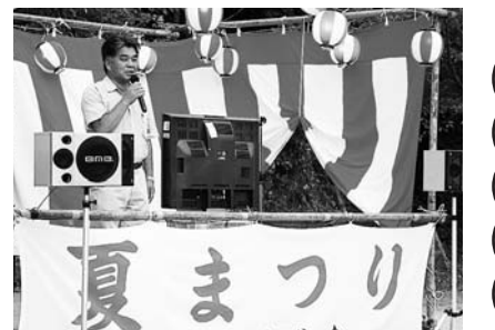
8月 「女の都」 夏まつり