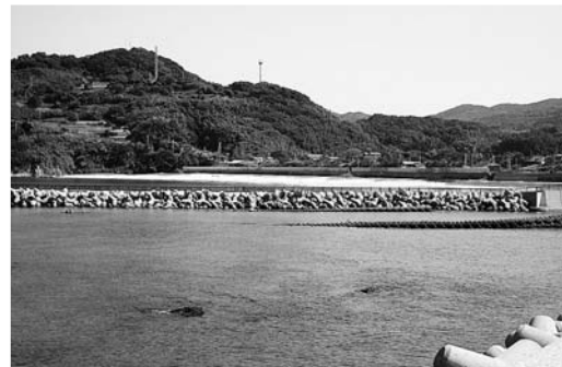
野母崎高浜海水浴場跡