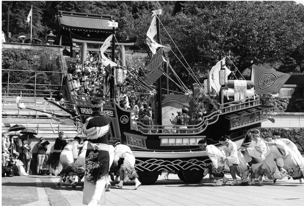
御朱印船（八坂神社にて）

平成25年11月 発行責任者：五輪 清隆 編集責任者：中山 好文 長崎市水の浦1の1 TEL861-6032