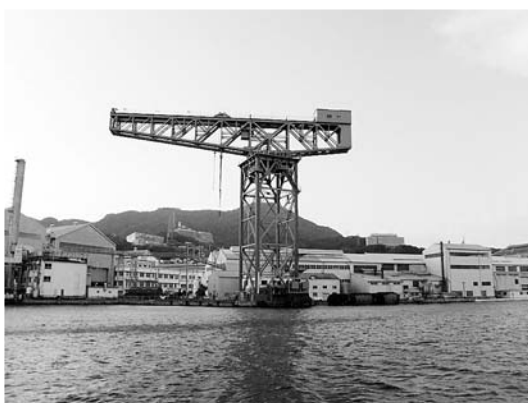
長崎港内からのジャイアント・カンチレバークレーン

現地視察を行いました 10月15日(火)に私が所属します、市民クラブ(14名)は「明治日本の産業改革遺産」が世界遺産の推薦候補となりましたので、長崎市に所在する構成資産の現地視察を行いました。 今回の視察で初めて、端島(軍艦島)に上陸しましたが学校・居住住宅・護岸の現状を見て感じた事は、劣化が著しくひどいので保存することが可能なのかと思いました。 又、稼働している資産の第三ドックやジャイアント・カンチレバークレーンは役目が終わった後の保存管理をどのようにするのか等の問題もあります。 今後、世界遺産が決まるまでに多くの財政負担を国・県と協議を早急に協議しなければなりませんので、その為に長崎市議会も長崎市と連携を図っていきます。