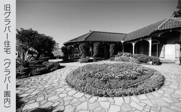
旧グラバー住宅(グラバー園内)