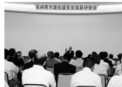
8月 長崎県市議会議長会研修会