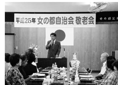
8月 「女の都自治会」 敬老会

対する取り組みについて審議を行いました。観光振興特別委員会は、宿泊・滞在型観光の推進のため、夜景の魅力をさらに高めるとともに、長崎の新たな魅力の創出に向けた課題を把握し、諸問題の解決に向けた検討を行い、来年1月の委員会で取りまとめ市長へ提言致します。