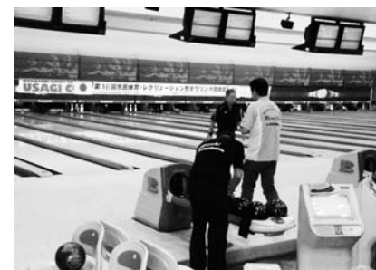
10月 市民・体育レクリエーション祭 (ボウリング競技大会)