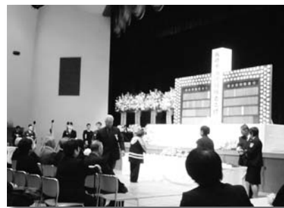
2月 消防殉職者追悼式