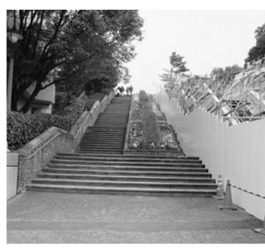
平和公園へのエスカレーターを設置中