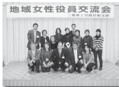
3月 地域女性役員交流会