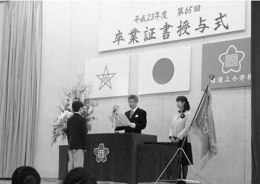
西浦上小学校の卒業証書授与式

桜の花も満開に咲きそろう、爽やかな季節となりましたが、皆さまにおかれましては益々ご健勝に、ご活躍のこととお喜び申し上げます。 希望に満ちた旅立ち 毎年3月は市内の小・中・高校の卒業式が行われ、それぞれの卒業式に出席しましたが、同級生との別れの寂しさと共に、希望に満ちた光景は、胸を打たれる光景であります。