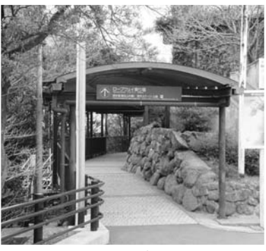
稲佐山山頂のロープウェイ入口通路

ロープウェイ稲佐岳駅舎から山頂駐車場への連絡通路を改修するとともに、既存迂回路の段差解消により利用者の利便性の向上を図り、稲佐山山頂の更なる魅