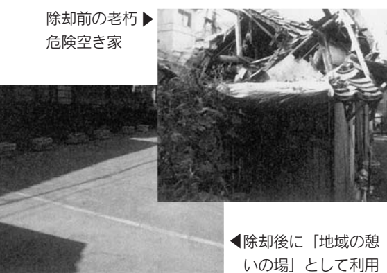
除却前の老朽危険空き家