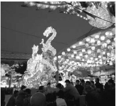
新地会場のオブジェ

〈中華大婚礼〉 ・実施時期 平成25年2月11日 ・パレード 観光通り〜銅座通り〜湊公園 ※パレード終了後、湊公園にて結婚式 ● グラバー園施設整備事業費 ……17億1,000万円 グラバー園に設置している「動く歩道」は建築後37年が経過していることから、利用者の長期的な安全性の確保や利便性の向上を図るとともに、維持管理経費の縮減を図るため、1号機お