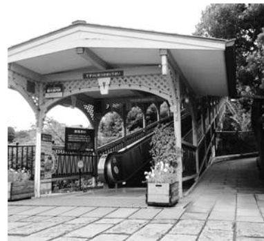
グラバー園の「動く歩道」

● 防犯行政無線維持管理費 ……4,286万4千円（拡大分） 防犯行政無線が聞こえにくい地域のうち、戸数が少ない集落などには屋外スピーカー設置に替えて各戸に防災ラジオを貸与するとともに、地域の防災活動の中心となる自主防災組織等に対しても同様に貸与する。 ● 購入数 500台 ● 老朽危険空き家対策費 ……2,222万円 市民生活の安全・安心の確保を目的として実施している老朽危険空き家の除却