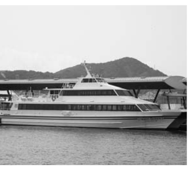
長崎〜伊王島〜高島航路 (高速船: コバルトクイーン)

● 離島航路維持対策費 ……1億475万2千円 離島航路は、本土と離島を結ぶ重要な公共交通機関であり、地域住民の生活に欠かせない移動手段であること、また、離島地域の振興を図る必要があることから、補助要綱に基づき、次の航路の維持・確保のため支援を行う。 ● 補助対象離島航路 ● 補助金の負担割合 県・市で1/2ずつ助成 ● 対象年度 H23・10月〜H24・9月