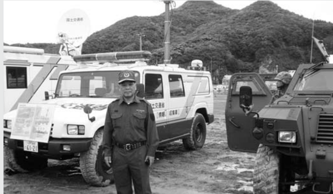
情報収集車前にて